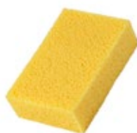
натуральная морская или синтетическая губка