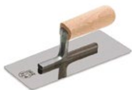
шпатель металлический (кельма)