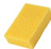
натуральная морская или синтетическая губка