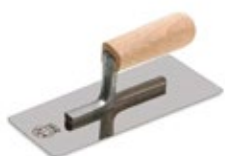
шпатель металлический (кельма)